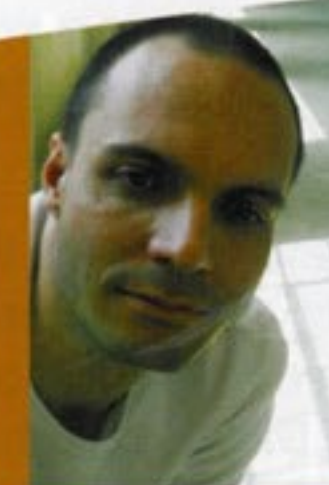
ing. arch. Radek Sládeček autor projektu